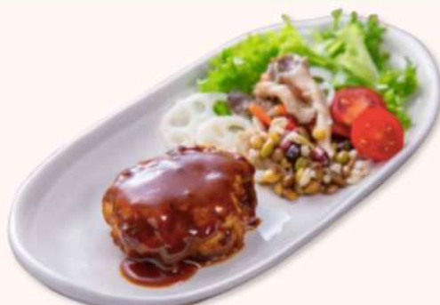
《和風ソースのハンバーグ》