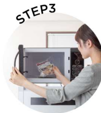
電子レンジで温める