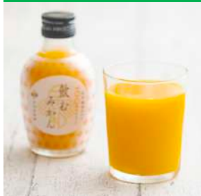
地方特産フルーツジュース