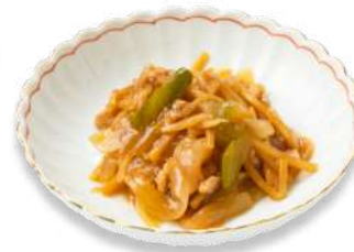
ご飯が進む! 青椒肉絲