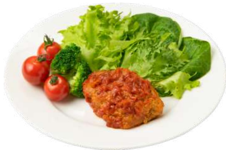
トマトソースの手ごねハンバーグ デミソースで煮込んだ手ごねハンバーグ