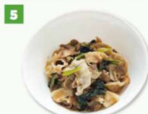
《豚肉と小松菜のにんにく炒め》