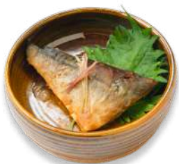
銚子産さば味噌煮