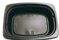
お皿 (仕切りあり・仕切りなし)