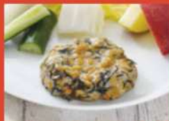
豆腐入りハンバーグ