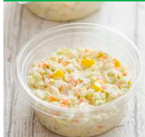
コールスローサラダ