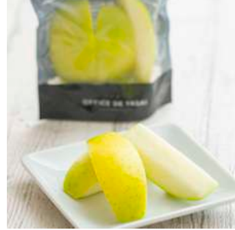
青森県産 カットりんご