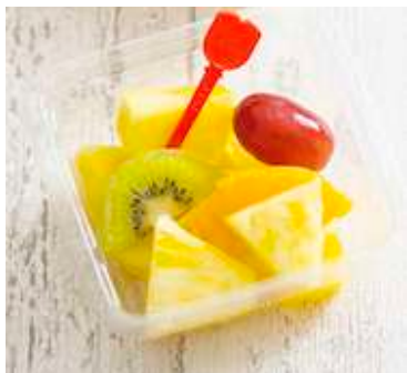
季節のカットフルーツ