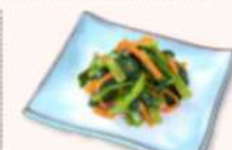
《国産野菜のナムル》