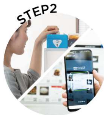
料金箱または電子決済で お支払い*