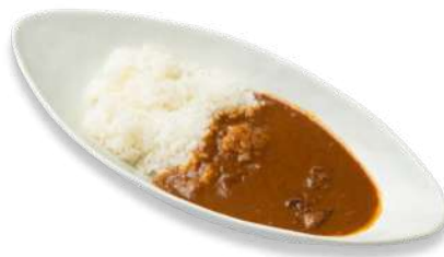
じっくり煮込んだビーフカレー