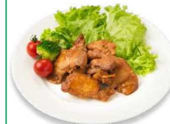
若鶏のやみつき ステーキ