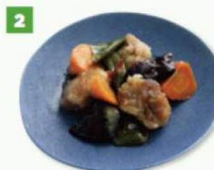
《鶏肉との茄子のピリ辛炒め》